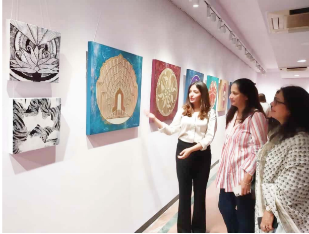
Bhopal's daughters are earning fame all over